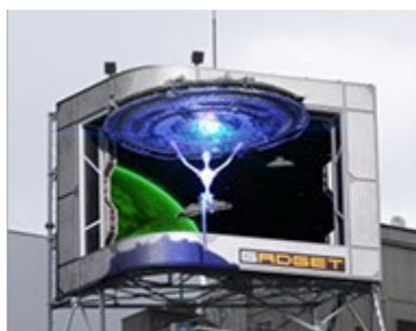
dipビジョン (宇宙人来訪)