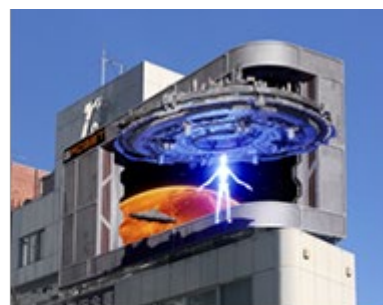
CHANGE ViSiON Harajuku (宇宙人帰還)