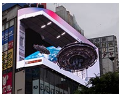
クロス新宿ビジョン (UFO来訪)

こちらは同じ素材を用いて、各ビジョンごとに可能な限り共通化しつつ、新たな演出を施したものとなっております。（プレミアム仕様）